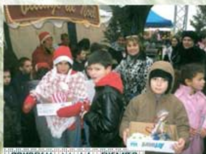
CONSEIL MUNICIPAL DES ENFANTS

...grâce à la persévérance des Jeunes du Conseil Municipal des Enfants.