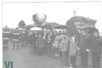
Les enfants de la ville de La Souterraine ont participé à la parade du 11 novembre.