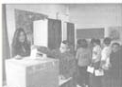
Un conseil des enfants se réunit avec ses membres.