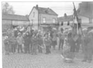
Les enfants de la ville de La Souterraine ont participé à la parade du 11 novembre.

La commémoration du 11 novembre, journée nationale de la paix, a été célébrée à La Souterraine.