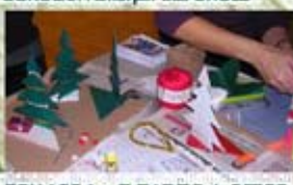
COLLAGE des ELEMENTS de DECOR