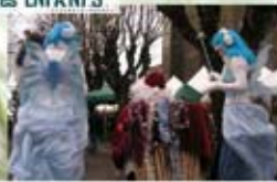
les FÉES BLEUES et le PÈRE-NOËL