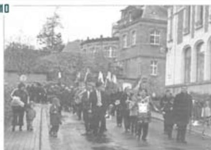
Les enfants de la ville de La Souterraine ont participé à la parade du 11 novembre.