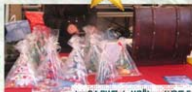
les SA PINS de NOËL en VENT E