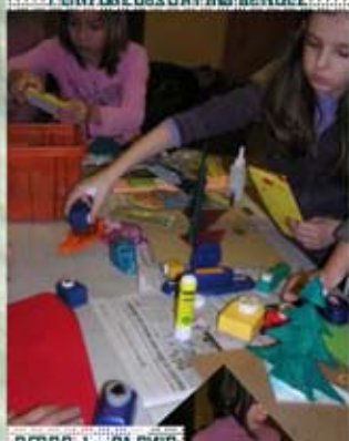
DECOR des SA PINS