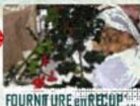
FOURNITURE en RECU'

Le résultat fut épatant parfois même surprenant mais dans tous les cas, enthousiaste.