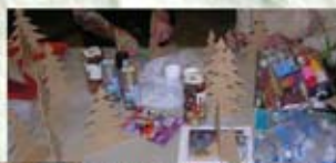
SAPINS en BOIS et son SOCLE