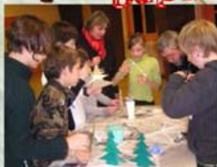
PEINTURE des SA PINS de NOËL