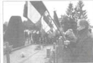
Les enfants de la ville de La Souterraine ont participé à la parade du 11 novembre.