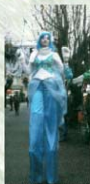
la FÉE BLEUE

LE THEME DE CE 8ÈME MARCHÉ DE NOËL EST MAGIE et FEERIE