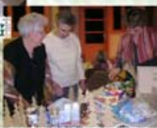
CONSBLM unicipal des SAGÉS